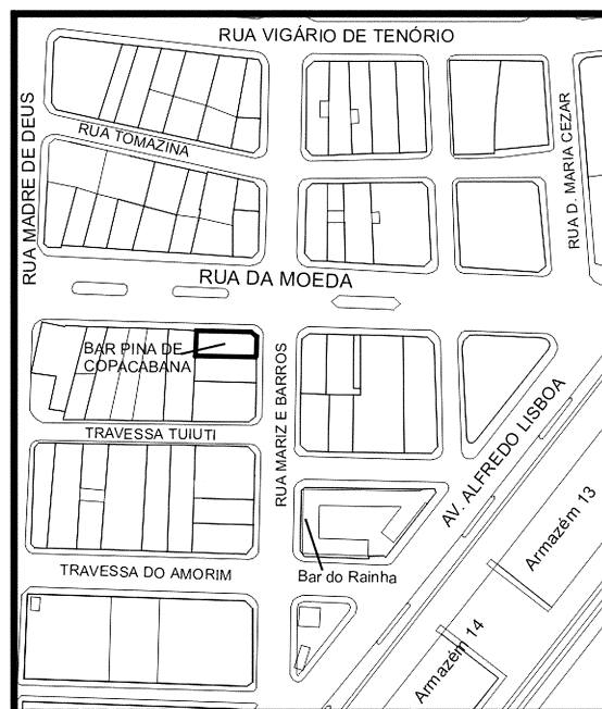
MAPA BAIRRO DO RECIFE DETALHE DO PÓLO MOEDA REFERÊNCIA CARTOGRÁFICA: MAPA-BASE BAIRRO DO RECIFE/ URB

tidos atribuídos – um espaço urbano, como uma public property (Gulick, 1998). O bar Pina de Copacabana, fechado nas primeiras horas do dia, era também uma edificação simbólica, mas, sem os usos, perdia parte da sua eficácia. À noite, quando outras sociabilidades se desenvolviam na rua, esses espaços se emprenhavam de significados: deixavam de ser meros logradouros públicos para se transformarem em lugares .